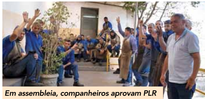
Em assembleia, companheiros aprovam PLR

Os trabalhadores e trabalhadoras na Dalferinox obtiveram uma vitória com o fechamento do acordo de PLR (Participação nos Lucros e Resultados) que prevê o pagamento de R$ 1.000 em parcela única para o dia 30 de novembro. Coordenada pelos assessores Maritaca e Zoinho, a assembleia foi realizada na quinta-feira, 17. Na ocasião da votação, os companheiros e companheiras também aprovaram o aumento do vale-refeição de R$ 26,00 para R$ 28,00.