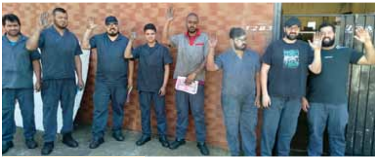
Braços estendidos em aprovação ao reajuste salarial

Na assembleia realizada no dia 17 de novembro, os trabalhadores na Alberic, em Santo André, pertencente ao grupo 10, aprovaram a proposta de reajuste salarial negociada pelo Sindicato e a empresa.