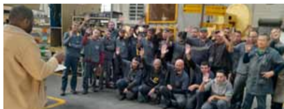
Reunidos em assembleia, metalúrgicos aprovam PLR na Pentágono

Em Santo André, os trabalhadores na Metalúrgica Pentágono aprovaram duas propostas: a troca do feriado de 9 de Julho (Revolução Constitucionalista) e a Participação