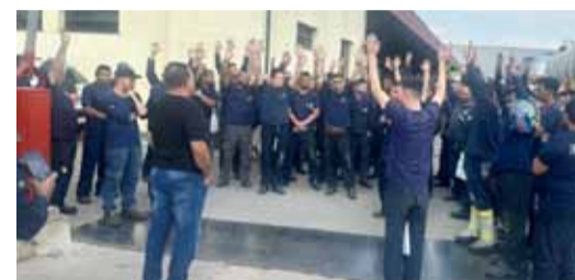
Companheirada aprova proposta de restaurante negociada pelo Sindicato

Metalúrgicos e metalúrgicas na Tanesfil, em Mauá, aprovaram a implantação do restaurante na empresa, durante assembleia, realizada na sexta-feira (5).