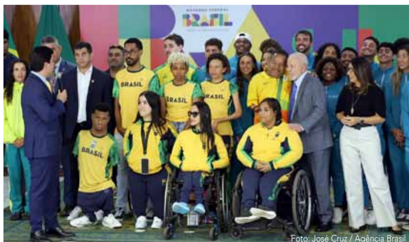
Atletas e paratletas que vão à Olimpíada são recebidos por Lula

O presidente Lula assinou na quinta-feira (11), reajuste de 10,86% no Bolsa Atleta que é pago a cerca de 9 mil atletas no Brasil. Esse é o primeiro aumento do programa em 14 anos. Às vésperas dos Jogos Olímpicos de Paris, que começam em 26 de julho, o benefício vai pagar entre R$ 410 e R$ 16.600. O programa é dividido em seis categorias: base, estudantil, internacional, olímpico/paralímpico e pódio (destinado a atletas de elite).