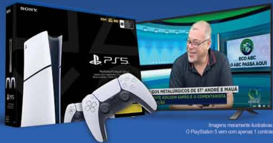
Imagens meramente ilustrativas. O PlayStation 5 vem com apenas 1 controle

Entidade comemora o aniversário neste domingo (22), com associados concorrendo a prêmios