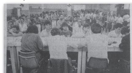
Cerca de 14 mil metalúrgicos receberam a devolução

Em janeiro de 1984, no II Congresso dos Metalúrgicos de Santo André e Mauá, em mais uma ação que prova o quanto o Sindicato estava sempre à frente em várias bandeiras de luta, a categoria dava um importante passo, decidindo pela devolução do imposto sindical, que começou a ser efetuada, em 1986, com aproximadamente 10 mil trabalhadores metalúrgicos recebendo de volta o dinheiro que o governo retirava, de forma compulsória, anualmente dos salários dos trabalhadores associados. Em 1987, cerca de 14 mil companheiros e companheiras receberam a devolução do Imposto Sindical. Inspirados por nossa entidade, outros sindicatos adotaram a mesma atitude.