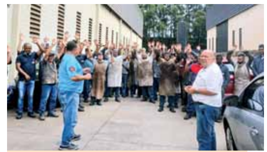
Sindicato mobiliza a companheirada, em conquista de Campanha Salarial

Por unanimidade, os trabalhadores e trabalhadoras na Waltermic, em Mauá, aprovaram durante assembleia realizada na porta da fábrica, na terça-feira (13), a proposta de reajuste salarial, com 6% a partir de 01 de janeiro de 2025 e abono salarial de 13,50% a ser pago no dia 15 de fevereiro.