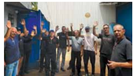
Proposta de Campanha Salarial é aceita pelos trabalhadores

Na assembleia realizada no dia 06 de janeiro, numa segunda-feira, os companheiros e companheiras na Gaspec, em Santo André, aprovaram, por unanimidade, o reajuste salarial de 6% a partir de 01/01/25.