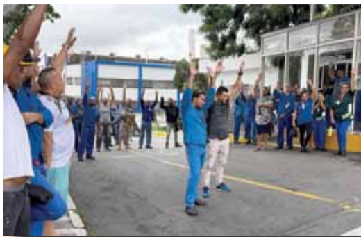
Sindicato nas fábricas, diálogo com os trabalhadores é fundamental na luta por conquistas

Na tarde da quarta-feira (19), os trabalhadores e as trabalhadoras na Tenneco, em Santo André, reunidos em assembleia organizada pelo Sindicato, votaram e rejeitaram a proposta da empresa sobre o calendário de compensação para o decorrer do ano.