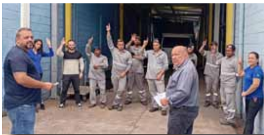
Conquista de PLR! Só a luta melhora as nossas vidas.

Na assembleia realizada no último dia 17, na Max Tec, em Mauá, os companheiros e companheiras aprovaram o acordo de PLR (Participação nos Lucros e Resultados) negociado entre a representação do Sindicato e a direção da empresa.